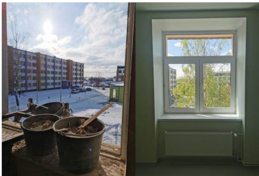
Projekts tiek īstenots Varoņu ielā 11a, Rēzeknē.