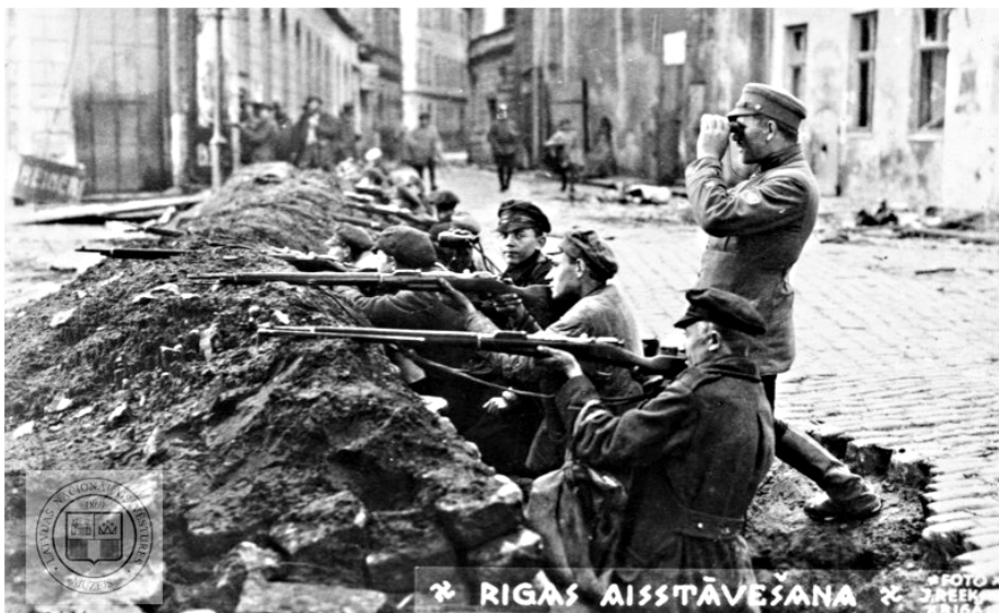
I 1 Latvijas armijas karavīri pozīcijās Daugavmalā (1919).