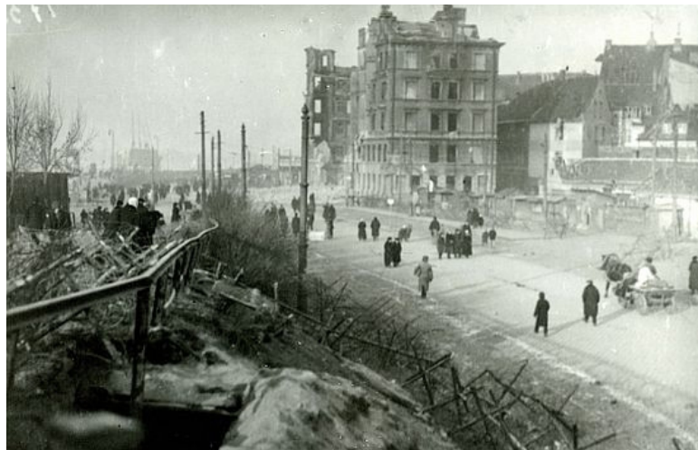
I 3 Sagrautā Daugavmala Rīgā (1919).