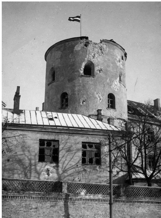
I 2 Bermontiešu sagrautais Rīgas pils Svētā Gara tornis (1919).