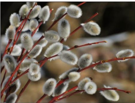
C / 1. Lieldienās zied skaisti pūpoli.