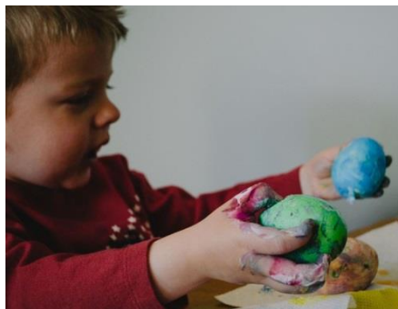
D / 2. Lieldienās bērniem patīk krāsot olas.