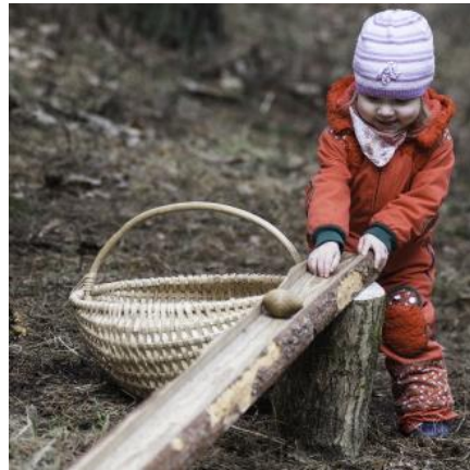
B / 3. Lieldienās bērni ripina olas.