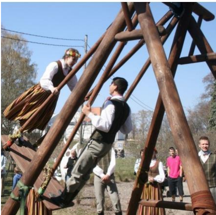
A / 4. Lieldienās meitenes un zēni šūpojas.