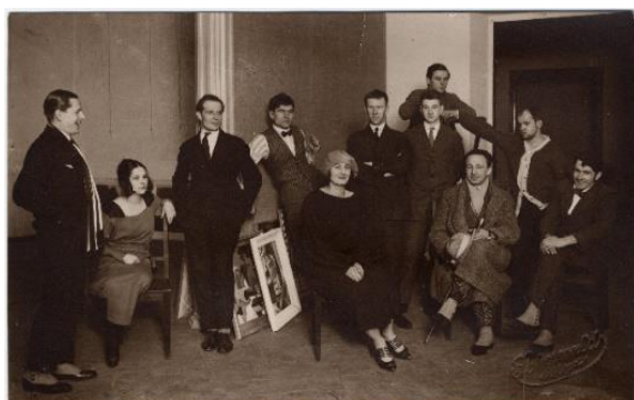
Skulmju dzimta 20. gadsimta 30. gados

Mācīties → viņš (viņa) mācīj-ās → viņš ir mācīj-ies / viņa ir mācīj-usies