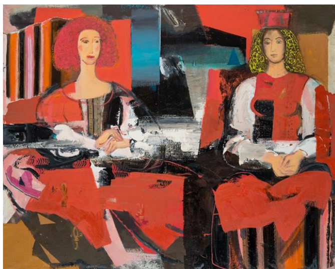
Džemmas Skulmes glezna „Dialogs”, 2000.