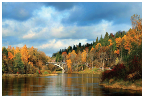
Gauja pie Siguldas