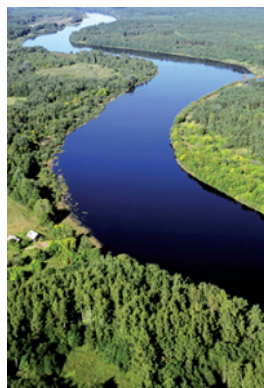
Dabasparks "Daugavas loki"