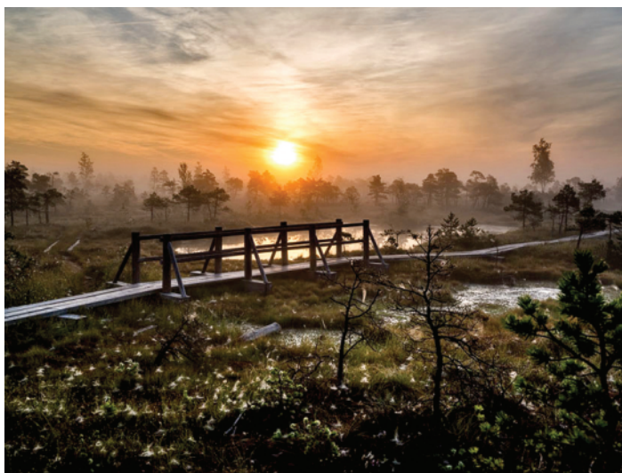
Lielais Ķemeru tīrelis (Ķemeru nacionālajā parkā)