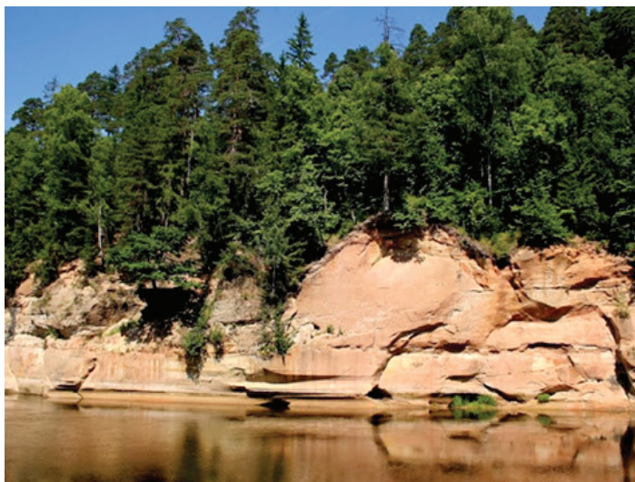
Velnalas klintis Siguldā (Gaujas nacionālajā parkā)