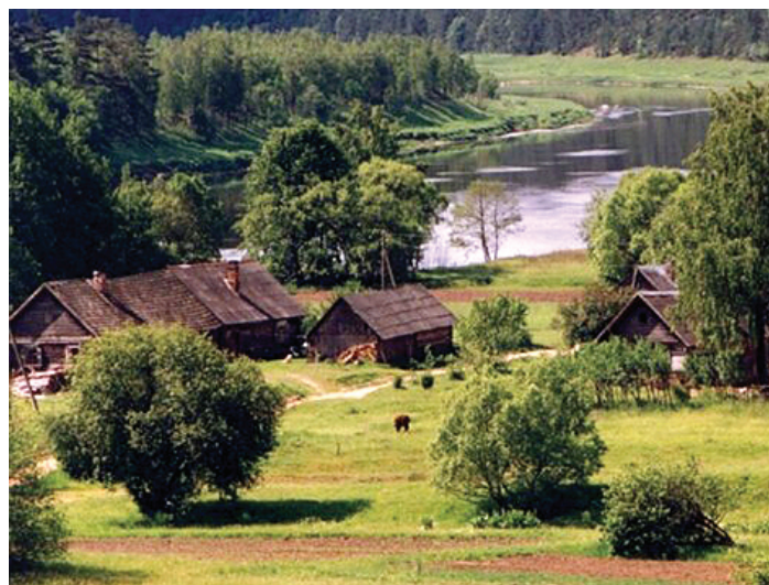
Skats no Lielā Liepu kalna (Rāznas nacionālajā parkā)