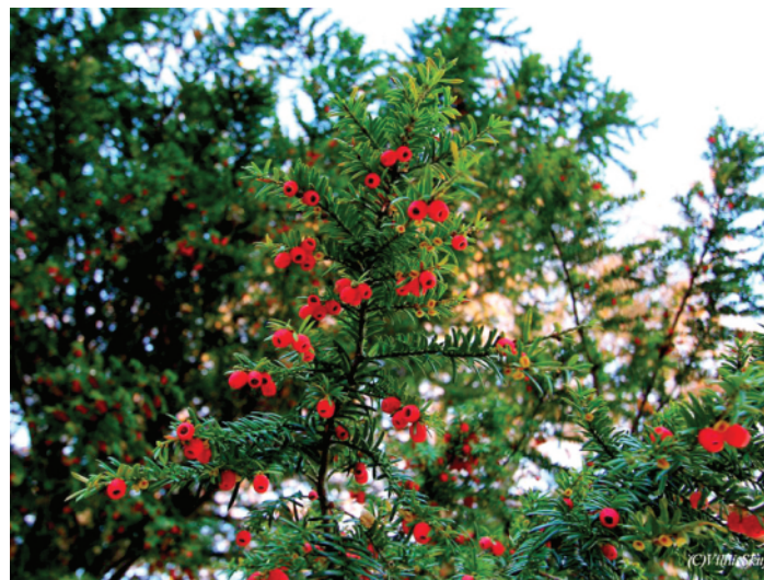
Parastā īve (Slīteres nacionālajā parkā)