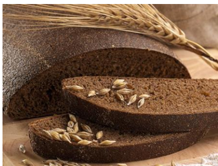
4. Rudzu maize jeb rupjmaize