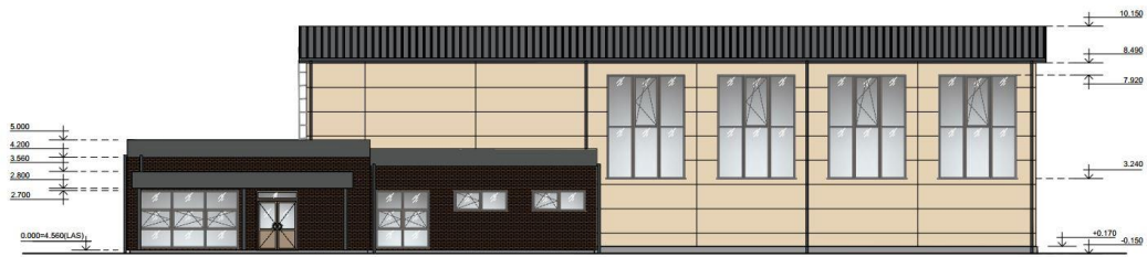
Projektējamās sporta zāles fasāde